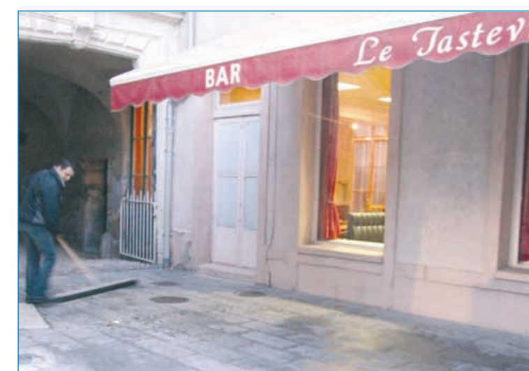
Au Tastervin, le lavage c'est 2 fois par jour !