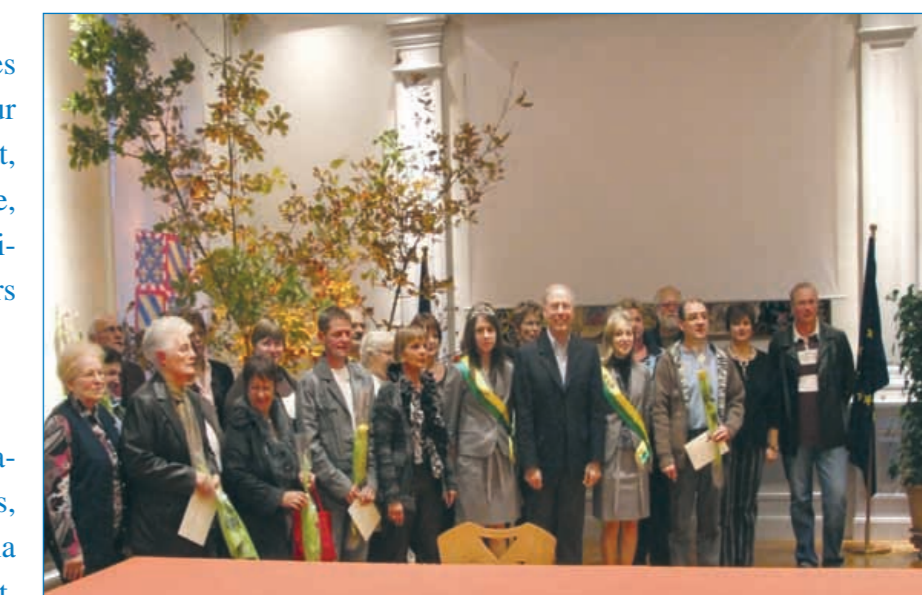
Les lauréats du concours des maisons fleuries

Outre suivre ces bons exemples, il faut faire mieux : ne plus nourrir les pigeons ni les chats errants, utiliser systématiquement les nombreuses poubelles installées en ville et dans les quartiers et surtout penser que l'espace public appartient à tous !