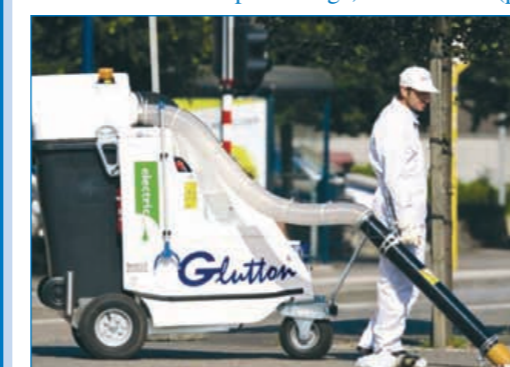
Le « glouton » sera bientôt en service en ville

Le tri nous concerne tous, à la maison comme à l'extérieur, et nous comptons sur votre participation pour y parvenir.