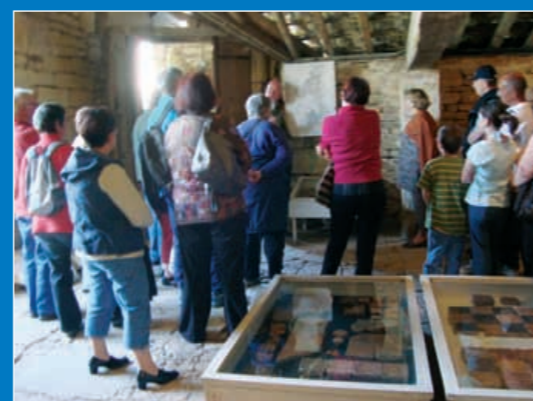
17 personnes se sont rendues au château de Germolles le jeudi 22 avril à l'occasion de la sortie patrimoine.