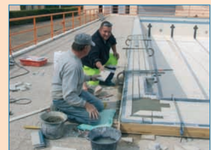
L'hiver a été très rigoureux et n'a pas épargné la piscine municipale. Des travaux importants ont été nécessaires pour remplacer tous les carreaux détériorés par le gel. La réouverture aura lieu le lundi 10 mai. Comme les années précédentes, pendant le temps scolaire, de nombreux élèves des écoles primaires et des collèges pourront poursuivre les cycles d'apprentissage de la natation.

11 agents des services techniques municipaux ont bénéficié d'une formation sur des engins type tractopelle, manuscopique, mini pelle et tracteur entre le 15 et le 26 mars dernier en vue de passer les C.A.C.E.S. - Certificat d'Aptitude à la Conduite En Sécurité - correspondants