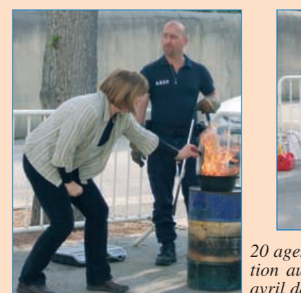
20 agents municipaux ont bénéficié d'une formation au maniement des extincteurs les 20 et 22 avril dans la cour de l'Hôtel de Ville.